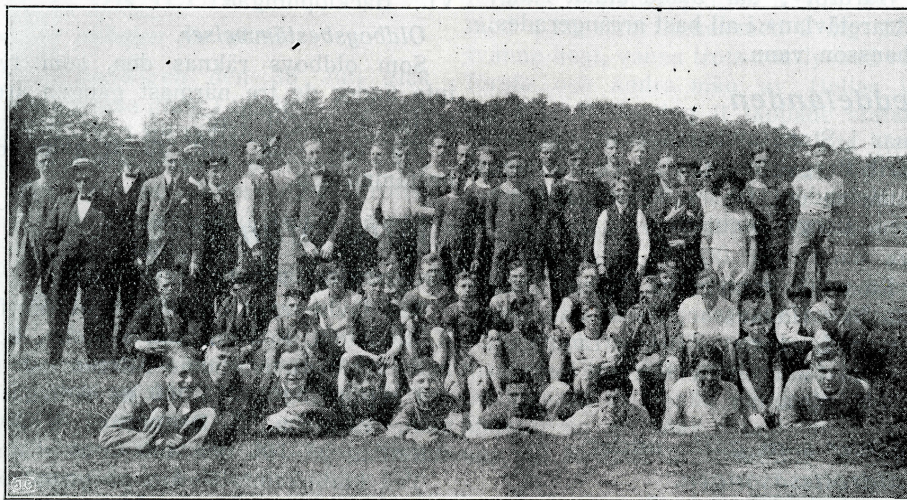
Från Svenska Dagblads-träningen.

Att redaktionen gått i författning om en praktisk samlings- och inbindningspärm till »Hellasbladet». Pär-