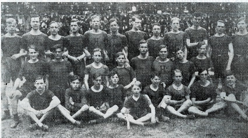
Hellas segrande ungdomslag den 4 juni 1916.